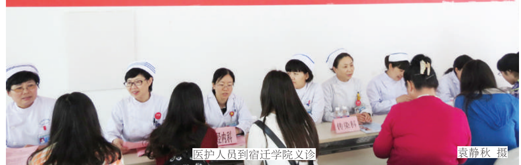
医护人员到宿迁学院义诊